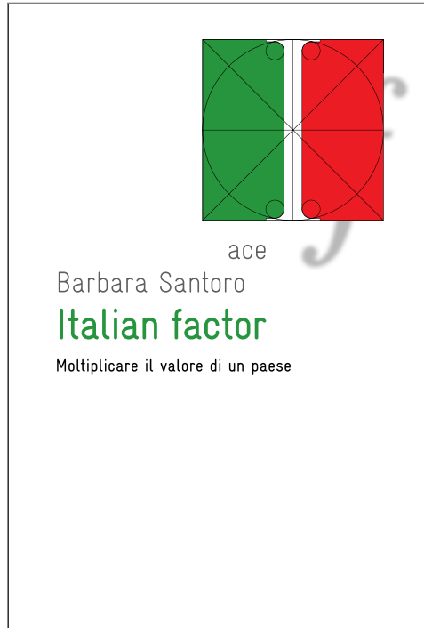
Libro Italian Factor www.amazon.it