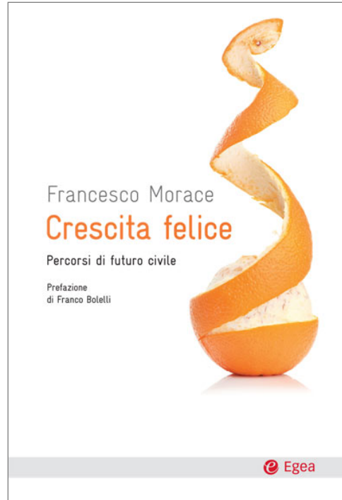
Libro Crescita Felice www.amazon.it